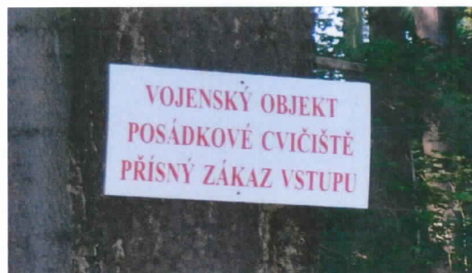
Příklady informativních zákazových tabulí umístěných v Posádkovém cvičišti Jince

Zákon č. 222/1999 Sb., zákon o zajišťování obrany České republiky